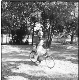
মানকর সাবোভাজার এক আদিবাসী রমণী পানীয় জল নিয়ে আসছেন সাইকেলে চড়ে।