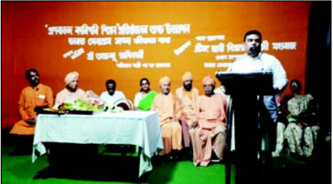
পূর্ব মেদিনীপুর জেলার মহিলাদের ভারতসেবাব্রহ্ম সম্বন্ধে প্রবন্ধন করিগরি শিক্ষা প্রতিষ্ঠানের উদ্বোধন করছেন রাজ্যের ভারপ্রাপ্ত পরিবহন ও পরিবেশ মন্ত্রী শুভেন্দু অধিকারী।