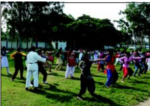
প্রসঙ্গত, প্রতিদিনই নারী নিরাপত্তার ঘটনা ঘটে কখনও না কোন এলাকায়। রাস্তাঘাটে, বাসে, ট্রেনে নিরাপত্তার শিকার হচ্ছেন

নিজস্ব সংবাদদাতা, কাঁথি : আকছার রাস্তাঘাটে মেয়েদের আত্মরক্ষার নিত্যনতুন অভিযোগ উঠছে রাজ্যের বিভিন্ন প্রান্তে। সেই নিয়ন্ত্রণের ঘটনার প্রশংসা তুলতে এগিয়ে এসে পূর্ব মেদিনীপুর জেলা পুলিশ প্রশাসন। জেলা পুলিশের সহায়তায় কাঁথি থানার উদ্যোগে 'শক্তি' কর্মসূচির অঙ্গ হিসেবে মেয়েদের কারাতে প্রশিক্ষণ শিখির শুরু হল রবিবার।