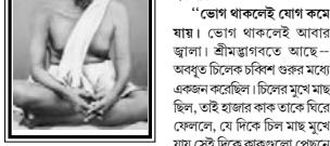
দক্ষিণেশ্বরে তাঁর শ্রীমার্কমুখ

কলা হয়। এই দেখ না, ছেলে মেয়ে হয়েছে, যাত্রা করা হচ্ছে—এই সব নামা কাঙ্ক্ষা দেখলেই মনে যোগ হয় না।”