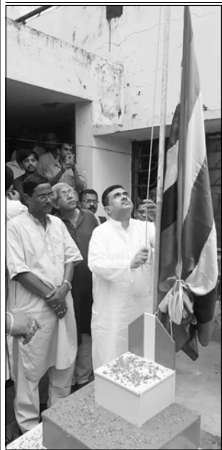
বিদ্যালয়পূর্ণ কেন্দ্রীয় সমন্বয় ব্যাঙ্ক লিমিটেডের অর্থ বাবিরক সাধারণ সভায় স্বেচ্ছাসেবকরা তথ্য বাক্সের পরিবহন ও পরিবেশ মন্ত্রী শুভেন্দু অধিকারী।

ক্যাম্পাস আগে খরিজ করা হয়। এমনি সরকারি রুক অফিস ও পুর অফিস ওলিভেও আধারের সমস্ত কাজ বন্ধ হয়ে যায়। এরফলে সাধারণ গ্রাহকেরা চরম সমস্যায় পড়তে থাকেন। এমনসময় জেলার কয়েকটি ব্যাঙ্কশাখা আধারের কার্যক্রম চালু হয়। সেখানে বাধাধারা নিয়ম করে রোজ ২০-৩০ জনের বেশি আধার কার্ড করেছেন। অনেকে আধার লাইনে দাঁড়িয়েও ৩০ জনের মধ্যে না থাকায় আধারের কাজ না করেই তাদের বিরত হচ্ছে। বর্তমানে মিড-ডে-মিলের ব্যাপারেও ব্যাঙ্ক জটিলতার সৃষ্টি হয়েছে। ফলে আট থেকে আশি সাইবার আধারের সমস্যার সম্মুখীন হচ্ছেন। উল্লেখ্য, পূর্ব মেদিনীপুর জেলার মর্ডেল রুক আগে মোট তিন জায়গায় আধার কার্ড করা হত। কিন্তু এখন তা শুধুমাত্র একটি ব্যাঙ্ক কাজ করা