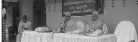
কীৰ্ত্তি ৰামকৃষ্ণ মিশনে সমাৰোহে পালিত হৈছে যুৱক স্বামী বিবেকানন্দৰ ১৫৬তম জন্মদিবস।