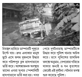
নিয়ন্ত্ৰণ হাৰিয়েৰে ডাম্পাৰটি পুৰুৰে উল্টে যায়। ভ্ৰুত এলাকাৰেৰে মনুষ্য হুটে ভয়ে জন্ম দুৰ্ঘনকে উদ্ধাৰ কৰে পৰিশপুৰ ব্লক হাসপাতালে ভৰ্তি কৰে। আশঙ্কাজনক অৱস্থায় তাৰে এগৰা সুপাৰ পেশালিটি হাসপাতালে ভৰ্তি কৰা হয়। খবৰ

নন্দকুমাৰ পান্ডা, ভগবানপুৰ : নিয়ন্ত্ৰণ হাৰিয়েৰে ৰাস্তাৰ বাবে একোটি ইলেক্ট্ৰিক লায়ন্সপোস্টকে ভেঙে উল্টে গেল বালি বোকাই ডাম্পাৰ। ঘটনায় ডাম্পাৰেৰে চালক-সহ খালসি গুৰুতৰ জৰ্ম হন। গুৰুতৰ ভেৰ চাচটা নাগাদ ঘটনাটি ঘটেছে ভগবানপুৰেৰে কোটবাড়ে। পুৰ্ণিম সূত্ৰে জানা গিয়েছে, ভেৰ প্ৰায় চাচটা নাগাদ একোটি বালি বোকাই ডাম্পাৰেৰে বালি নিয়ে পটাশপুৰ থেকে ভগবানপুৰেৰে দিকে যাচ্ছিল। বেপোৰায় গতিতে থাকল জনাই ডাম্পাৰটি সেই সময় নিয়ন্ত্ৰণ হাৰিয়ে থখনে ইলেক্ট্ৰিক লায়ন্সপোস্টে ধাক্কা মালে, তাৰপৰ