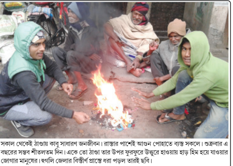
সকাল থেকেই ঠাণ্ডায় কবু সাধারণ জনজীবন। রাস্তার পাশেই আতন পোহাতে বাস্তব সঙ্কট। ওভারহেডের সঙ্কট হওয়ায় শনিবার ওভারহেডে বন্ধ ধরনের বিপর্যয়ের কারণে আটকে পড়ল দুর্গাপুরগামী আপ ট্রাক ডায়মন্ড এক্সপ্রেস। এর জেরে আপ ওপন লাইনে দীর্ঘক্ষণ ট্রেন চলাচল বন্ধ থাকে। তবে ২নং মেন লাইন দিয়ে আপ ট্রেন ও ১নং লাইন দিয়ে ডাউন ট্রেন চালানোর উদ্যোগ নেওয়া হয়েছে। এদিন সকালে সাড়ে ৫টা ৫০ মিনিটে ওভারহেডের ট্রেন চলাচল স্বাভাবিক ছিল।