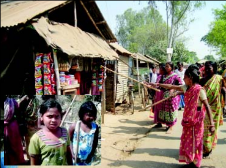
লাঠি হাতে মদের দোকান হানা প্রমিলাবাহিনীর। (হিসসেটে) সন্মিলন হয়েছে খুদে পছন্দীরাও।