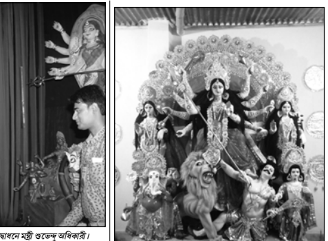
আনোদিপেশনের পূজা উদ্বোধনে মন্ত্রী গুরুদ্বৈ অধিকারী।

কঠিন পরিশ্রমের ফল আভ পেতে পারেন। যত সময় গড়াচ্ছে ততই মুকল আসবে।