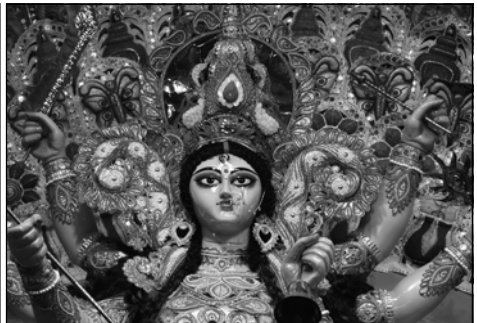
পাইকপাড়ায় গাঙ্গুলিপাড়ায় নেনদের দুর্গা প্রতিমা।