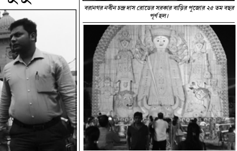
হাওড়ার সজীব সশের মণ্ডপে সবেলে বড় দুর্গা।

নিজস্ব সংবাদলাভা, হাওড়া: মুকুল রায়কে নিয়ে কমা চর্চা হচ্ছে না রাজ্য রাজনীতিতে। সেই মুকুল রায় মন্ত্রণালয় বেলেড় মঠে এসে সেই বিতর্ক উদ্ভে দিলেন। পূজার পর রাজ্য রাজনীতিতে বড়সড় চমকের বিষয়ে ফের প্রত্যাশী সূর শোনাচ্ছেন সাদা তু মুল ছাড়া। আসন্ন তথ্য মকলা সেকেন্ড ইন কমা মুকুল রায়।