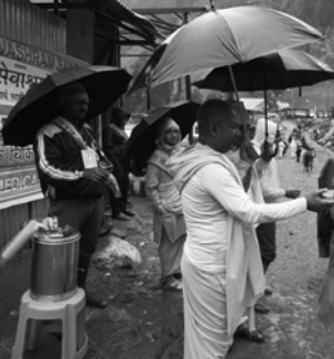
নিজস্ব স্ববাদ্দাতা, হাওড়া: অমরনাথ যাত্রীদের পাশে ভারত সেবাশ্রম সঙ্ঘ।

নিজস্ব স্ববাদ্দাতা, হাওড়া: অমরনাথ যাত্রীদের পাশে ভারত সেবাশ্রম সঙ্ঘ। অমরনাথ যাত্রীদের পাশে ভারত সেবাশ্রম সঙ্ঘ।