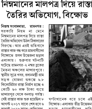
মহানগরীর সড়ক কাজের দৃশ্য

নিজস্ব স্ববাদ্দাতা, কল্যাণী: কল্যাণীতে জোড়া খনের ঘটনায় গ্রেফতার ১ জন। বৃহস্পতিবার জোড়া খনের ঘটনায় গ্রেফতার ১ জন।