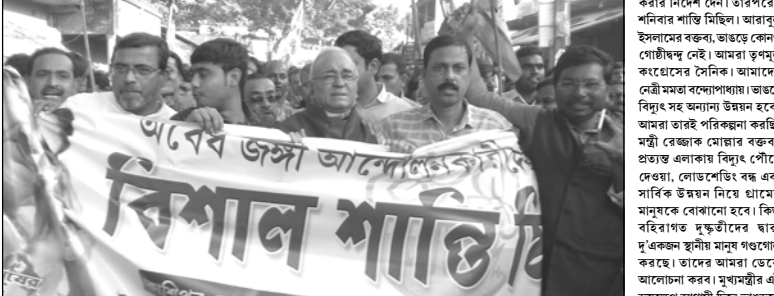
নিজস্ব সংবাদদাতা, কাকদ্বীপ : ভাঙড়ে শনিবার শান্তি মিছিল।