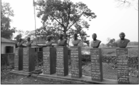
নকশাল বাড়ির শহিদ বেদি।

আন্দোলনের প্রথম অধিবুদ্ধি দেখা দিয়েছিল, তাই তাঁরাই হাত ধরে এমেন নামকরণ। মেমেন ছিল সেই বিপ্লবের প্রতীক। মুক্তা বলছেন, যাঁরা এগিয়ে এসেছিলেন, তাঁরা চলে যান গেলে। তার আগে গ্রামে-গ্রামে আমরা টহল দিয়েছি। চালাবো হয়ে ছে নানা মিশন। কখনও পুলিশকে ঘেরাও করা হয়েছে। অশোকের স্মরণ। পঞ্চাশ বছর আগে যে নকশাল আন্দোলন মাথাচড়া দিয়েছিল, তা কি বর্ষা? প্রায় পঁচাল্লিশ বছর আগে ২৪ মে শান্তি মন্ত্রকের স্বয়ং কুড়ি বসে এক গরিব ভাগ্যবির হয়ে রুখে দাঁড়িয়েছিলেন। সে কৃষক উৎপাদিত ফসল থেকে বেশি পরিমাণ অংশীদারি দাবি করেছিলেন। শান্তির ১৫ মাসের শিত ছিল তাঁর পিঠে ঝাঁপা স্মেডে, আর যিনি পর পর তির ছুড়িয়েছেন। এক পুলিশ সেই তিরে কিছু হয়ে মারা যায়। সেখানে থেকে হাসমা ছড়িয়ে পড়ে। যা একটি প্রজন্মকে উদ্দীপিত করেছিল। সেই আন্দোলন ক্রমে ছড়িয়ে পড়েছিল সারা দেশে। সেদিনের আন্দোলনে যাঁরা হাতে অস্ত্র তুলে নিয়েছিলেন, তাঁদের বলা হয়েছিল নকশাল। উত্তরবঙ্গের নকশালবাড়িতে যেহেতু সেই