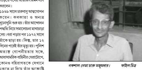
নকশাল নেতা চারু মজুমদার।