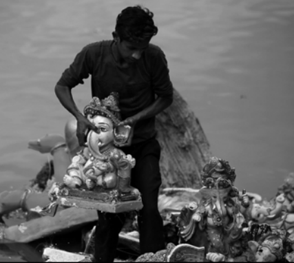
১০ দিনের দীর্ঘ গণপতি উৎসব শেষে আহমেদাবাদের সরমতী নদীতে সঙ্গীর দেবতা গণেশের বিসর্জনের আগের মুহূর্ত।

এর আগে স্থানীয় আদালত সাহাবুদ্দিনের বিরুদ্ধে ২০০৪ সালে আসিড হত্যাকাণ্ডের জেরে যাবজ্জীবন কারাদণ্ড দিয়েছিল। সেই শাস্তির বিরুদ্ধে সাহাবুদ্দিন পাটনা হাইকোর্টে যান। কিন্তু পাটনা হাইকোর্টে স্থানীয় আদালতের রায় বহাল রাখল। আরজেডির পক্ষে নিসন্দেহে বড় আঘাত। দলের দুর্দিনে সাহাবুদ্দিন তাদের পক্ষে নেই। লালুপ্রসাদ যাদব ও তার পরিবারের দুর্নীতিকে কেন্দ্র করে সরব হয়েছিল বিজেপি। সিবিআই, হিউ ও আয়কর হানা হয়েছে লালু ও তার পরিবারের সদস্যদের একাধিক বাড়িতে। এই ঘটনা মোটেই ভাল চোখে দেখেননি নীতীশ কুমার। তিনি বিজেপির সঙ্গে হাত মিলিয়ে বিহারে নতুন সরকার তৈরি করেছেন। আক্ষরিক অর্থে এখন আরজেডির পক্ষে সুসময় নয়। এর উপর লালুর ঘনিষ্ঠ হিসেবে পরিচিত সাহাবুদ্দিনের জেল থেকে ছাড়া পাওয়ার সম্ভাবনা ক্রমশ মিলিয়ে যাচ্ছে। ফলে মনখারাপ লালু ঘনিষ্ঠ নেতাদের।