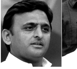
লখনউ, ১৪ সেপ্টেম্বর : ক্যালিফোর্নিয়া বিশ্ববিদ্যালয়ে ভাষণ দিতে গিয়ে রাহুল একটি অপ্রীতিকর প্রশ্নের মুখোমুখি হন। তাঁর কাছে জানতে চাওয়া হয়, ভারতে নেহরু-গান্ধি পরিবারের পরম্পরা নিয়ে। নেহরু-গান্ধি

পৃথক অনেক ভারতীয়ই যে বিভিন্ন ক্ষেত্রে উত্তরাধিকার বহন করে চলেছেন সেই উদাহরণ টেনে আনেন। উত্তর প্রদেশের প্রাক্তন মুখ্যমন্ত্রী এবং অধুনা কংগ্রেসের জেটিসম্মী সাজ্জবানী দলের নেতা অখিলেশ যাদব বৃহস্পতিবার রাহুল গান্ধির স্বপক্ষে দাঁড়িয়ে বলেছেন, ভারতে বংশানুক্রমিক শাসন বর্ধন ধরেই চলেছে। বিশ্ব ইতিহাসের দিকে তাকালে দেখা যাবে, এরকম উদাহরণ ভূরি ভূরি রয়েছে। বহু নেতাই রাজনীতিতে এনেছেন পারিবারিক উত্তরাধিকারের জেরে। লখনউতে দলের সদর দফতরে সাংবাদিক সম্মেলনে যাদব এই মন্তব্য করেন। সাংবাদিকদের এক প্রশ্নের