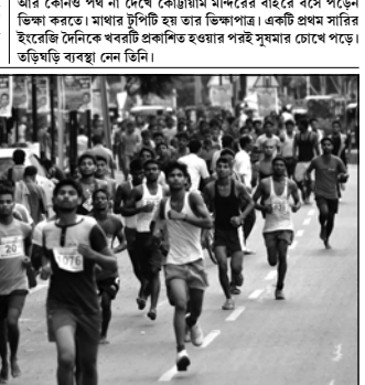
পাটনার জনতা দলের (সংযুক্ত) উদ্যোগে মুম্বায়র রাজ্যভূত্রে বালাবিবাহ ও পঞ্চপ্রথা বন্ধের দাবিতে তুলে ধরতে হাফ-মারাথন অর্শে নিলেম যুবকরা।