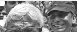
রাষ্ট্রপতি মোদি গুজরাতের মুখ্যমন্ত্রীর সঙ্গে

প্রসঙ্গত, ব্রহ্মপুত্র নদীসঙ্গম অঞ্চলেই অসমের মানুষের জীবনে গুরুত্বপূর্ণ ভূমিকা নিয়ে চলেছে।