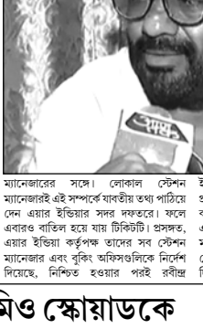
শিবসেনার সাংসদ রবীন্দ্র গাইকোয়াড়

তাই শিবসেনা কর্মীরা নামানো গাইকোয়াড়ের জন্য টিকিট কাটার চেষ্টা করছেন, কিন্তু ছদ্মনাম ব্যবহার করে তার কা টিকিট কাটা সম্ভব হননি। চলতি সপ্তাহের গোড়াতে সেনার এক সদস্য এয়ার ইন্ডিয়ায় রুল স্টেশনে যেন কয়েকবারের জন্য টিকিট বুক করতে চান।