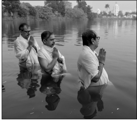
আগরতলায় সোমবার পিতৃপক্ষের সমাপ্তি, বদৌপক্ষের সূচনায় পিতৃ পক্ষের উদ্দেশ্যে চলছে তপন

মুম্বই, ৮ অক্টোবর : ২০১৯-এর বিধানসভা নির্বাচনের পরও তিনি রাজ্যের মুখ্যমন্ত্রী থাকবেন বলে স্পষ্ট জানালেন মহারাষ্ট্রের মুখ্যমন্ত্রী দেবেন্দ্র ফড়নবিশ। মহারাষ্ট্রের লাতুর জেলায় সোমবার এক সমাবেশে ভাষণ দিচ্ছেন তিনি। সেই সমাবেই তিনি জানান, পরবর্তী পর্যায়ে মুখ্যমন্ত্রী থাকা নিশ্চিত বলে। এমনকি রীতিমতো আয়ুর্বিষায়ের সঙ্গে ফড়নবিশ বলেছেন, ২০১৯-এর বিধানসভা নির্বাচনেও পরের যে সময় তা শুধু বিবেচ্য। এই টার্মে তিনি লাতুরের মান্যবরে তাদের উদ্দেশ্যমূলক ভাষণের জন্য টিকারদায়ক কোনও অভ্যর্থনা হবে না বলেও স্পষ্ট জানিয়েছেন। এছাড়া মারাঠিগোড়া ছাত্রদের এদিন তিনি একটি ছেলে ক্যামেরা উদ্দেশ্যে বলেন, ওই অনুষ্ঠানেও ভাষণ দিতে গিয়ে তিনি একই কথা বলেন। সরকার পরিচালিত মেডিক্যাল কলেজ ও হাসপাতাল সম্পর্কে ফড়নবিশ জানান, রাজ্যে আরও বেশি খোঁজ সরকার পরিচালিত মেডিক্যাল কলেজ ও হাসপাতাল তৈরি হচ্ছে। এজন্য ১০০ কোটি টাকার হস্তমিল গণরাজ্য সম্পূর্ণ হয়েছে। তিনটি পর্যায়ে হবে এই কাজ। আগামী দু'বছরের মধ্যেই প্রকল্পটি শেষ হবে বলেও মন্তব্য করেন মুখ্যমন্ত্রী। প্রসঙ্গত, ফড়নবিশ গত বছর কেরালা মন্ত্রী হিসেবে তাঁর অধীনি পরিচালনা যোগানদের খবর শেখার পর বলেছিলেন পুরোটিই ওজব। মুখ্যমন্ত্রী হিসেবে আরও এক বছর মেয়াদ রয়েছে দেবেন্দ্র ফড়নবিশের।