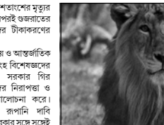
গির অরণ্যে সিংহের মৃত্যুর কারণ তাও জানা যায়। আইসিআরআর দাবি করে, এই নির্দিষ্ট ভাইরাসই পূর্ন অগ্রিকার

সিংহদের টিকাকরণও শুরু করেছে। টিক তার একদিন পরেই গিরের সিংহদের সম্পর্কে রাজ্যের মুখ্যমন্ত্রীর মন্তব্য শোনা গেল। প্রসঙ্গত, এক মাসেরও কম সময়েই মরে গির অরণ্যে কয়েকটি সিংহ মৃত্যু হয়। প্রথমে চোরাকালিকারীর কথা মনে করা হয়েছিল। কিন্তু পরে তদন্তে নেমে বন দফতর দেখে আবিষ্কার হয়েছে মৃত্যু হয়েছে কালাইন ডিম্বকোষের অসুস্থতা (সিডিডি) এবং প্রোটোজোয়া ইনফেকশনের। তারপরই বন দফতর ইন্ডিয়ান কাউন্সিল অফ মেডিক্যাল রিসার্চ ও ন্যাশনাল ইনস্টিটিউট অফ ভাইরোলজির সঙ্গে যোগাযোগ করে। তারাও ভাইরাসের হাদিগ পাঠ। এই ভাইরাসই যে গির অরণ্যে ২০টি সিংহের মৃত্যুর কারণ তাও জানা যায়। আইসিআরআর দাবি করে, এই নির্দিষ্ট ভাইরাসই পূর্ন অগ্রিকার