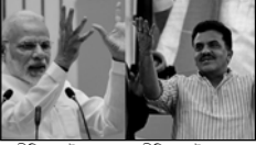
মৌজিগিরে এই নোংরা রাজনীতি এখনই থামানোর কথা বলে মহাশক্তি কংগ্রেসের সভাপতি দাবি করেছেন, গত ২৯ সেপ্টেম্বর ১৪ মাসের এক শিশুকে ধর্ষণ করা হয়। সে ঠাকুর সম্প্রদায়ের। সরকার ছেড়ে দেওয়ার সিদ্ধান্ত নিয়েছে গুজরাত সরকার।