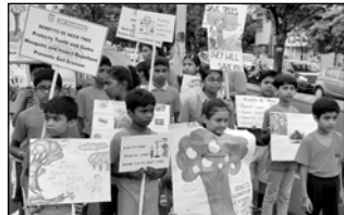
‘পরিত্যেচ বাঁচ’ সচোনতরা রাণিতেরবিবির মোটেইত প্রাকার্ত হাতে হেটরা।