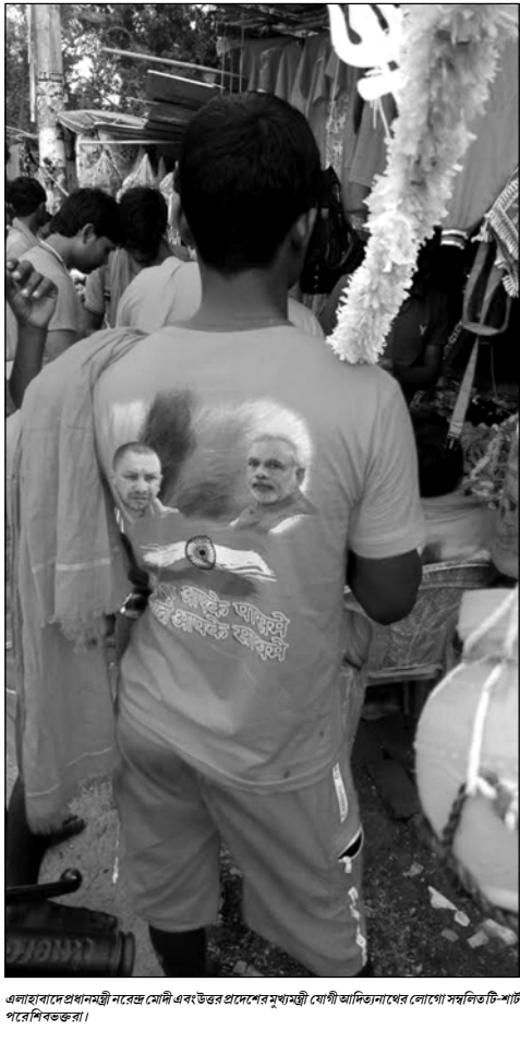
এনাহাবাৎপ্রধানমন্ত্রী নরেন্দ্র মোদী এবং উত্তর প্রদেশের মুখাম্মদী যোগী আদিত্যনাথের সঙ্গে সফলিটটি-শাট পরেশিবভক্তরা।