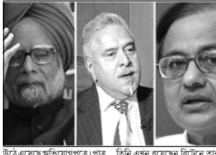
উইট এসেছে অভিব্যোগের। পাত রাজ্যে বিধানসভা নির্বাচনের ঠিক খেলোড়ি বিজেপি তার পুরনো তাস খেলেন।