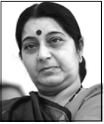
সু্যমা স্বরাজের পাশে বংশোদ্ভূত বৃদ্ধার পাশে দাঁড়ানেন বিদেশমন্ত্রী।

নয়া দিল্লি, ৩০ জানুয়ারি : বিদেশমন্ত্রী সু্যমা স্বরাজের ফের মানবিক মুখে দেশে ফের। ভিসা ইস্যুতে ভারতীয় বংশোদ্ভূত এক বৃদ্ধার পাশে দাঁড়ানেন বিদেশমন্ত্রী।