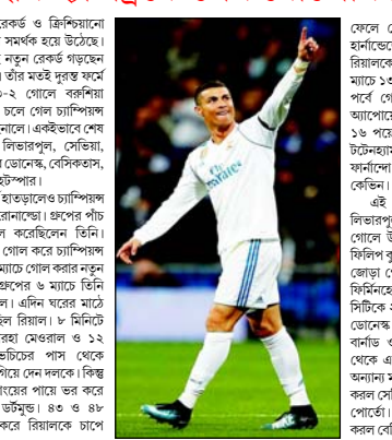
মাত্র ৭ ডিসেম্বর: রেকর্ড ও ক্রিস্টিয়ানো রোনাল্ডো একে অপরকে সর্ধর্ধ হতে উঠেছে। বধ পায়ে ম্যাচে মারকেই নুন বেরত তুলেছেন এই পুর্নকালি হুয়ারলকার। তাঁর মতই দুরন্ত সর্ধর্ধ থাকা রিয়াল মাদ্রিদ ৩-২ গোলে বর্ধর্ধা উর্দম্বিয়ে উটমিয়ে দিল। চলে গেল চ্যাম্পিয়ন্স লিগের চৌ-বোলারের ইনিংস। একেভাবে শেষ হোয়েয় গৌয়ে গেল লিভারপুল, সেন্টাঙ্গা, ম্যাগেফ্রান্সি মিটি, ম্যাগের ডোমেনক, বেনিকতাস, পোর্টো এবং টেলিফোনিকাস টিমস।