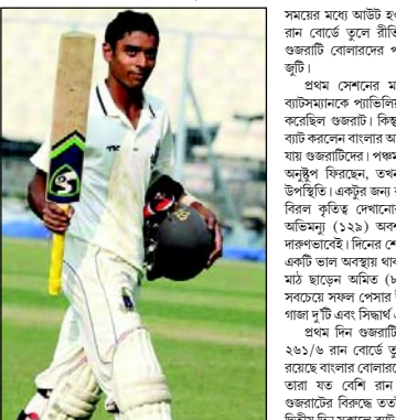
সময়ের মধ্যে আউট হওয়া চাপে পড়ে যায় বাংলা। ৪১/৪ রান বোর্ডে তুলে রীতিমতো পূর্নকাল দল। এদিকে ওজরাটি বোলারদের ঠাট্টা দিলেন অভিনয়ু।

জমপুর, ৭ ডিসেম্বর: মহাভারতের অভিনয়ু কৌরবের চক্রবূহ ভাঙতে বার্থ হয়েছিলেন। কিন্তু রঞ্জি ট্রফির কোয়ার্টার ফাইনালে জমপুরের সোহাই মন সিং স্টেডিয়ামে ওজরাটি বোলারদের চক্রবূহ ভেঙে ওড়িয়ে দিলেন বাংলার তরুণ তপন্যর অভিনয়ু ঈশ্বর। উর্দেটিক দিয়ে তাকে যোগ্য সম্মতি দিলেন কথীন অনুষ্ঠুপ মজুমদার। এই চৌ বাটসম্যানের দুরন্ত ইনিংসে ভর করে প্রথম দিনের স্কোর ২৬১/৬ রান বোর্ডে তুলেছে বাংলা।