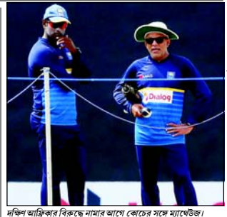
দক্ষিণ আফ্রিকার বিরুদ্ধে নামার আগে কোচের সঙ্গে ম্যাঠেইঙ।

কিছু তান্তেও প্রাথমিক দ্বিগ মোহনবাগানের কাজ করতে অসুবিধা হতানি তাগের। প্রথম সূত্র-বোশেপিসের নেতৃত্বে তেরি কমিটি আগামী মরৎকরে দরগমত করা। এরপর লিগ গুঞ্জয় এগিয়ে লাস্ট নামে স্ক্রো তেরি হওয়া আচল্যবাহ্য। হা। সুখসেব নিসেরে ট্রান্সফার ফি দেওয়া হতানি, কারণ কাটাতে উদ্যোগী হলেন দুই কড়া। ক্যামকসের ইস্টবেঙ্গলও তাকে নেওয়ার দাবি জানিয়েছে।