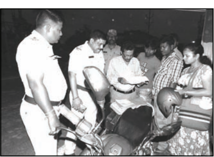
নং জাতীয় সড়কেও বিশেষ চেকিং চালিয়েছে উচ্চপদস্থ পুলিশ আধিকারিকরা। এইরকম একটা জায়গায় দেখা গেল মোটর বাইকে

নিজস্ব সংবাদদাতা, কাকদ্বীপ: সড়ক দুর্ঘটনা এড়াতে মুখ্যমন্ত্রীর নির্দেশে এবার কঠোর পদক্ষেপ নিল রাজ পুলিশ। সেই সঙ্গে দক্ষিণ ২৪ পরগনা জেলাজুড়েও শুরু হয়েছে পুলিশ অভিযান।