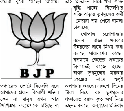
পঞ্চায়েত ভোটে বিজেপি হবে আমাদের প্রধান বিরোধী শক্তি। কেন না মানুষ এখন আর সিপিএম, কংগ্রেসকে চাইছে না