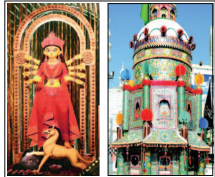
শুভ শারদীয়া ও পবিত্র বীদ উৎসবে সঙ্গীতের মঞ্চন হোক