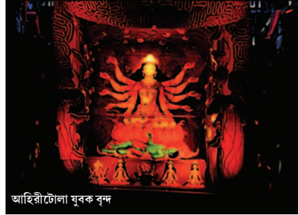
আহিরীটোলা মুরক বৃন্দ