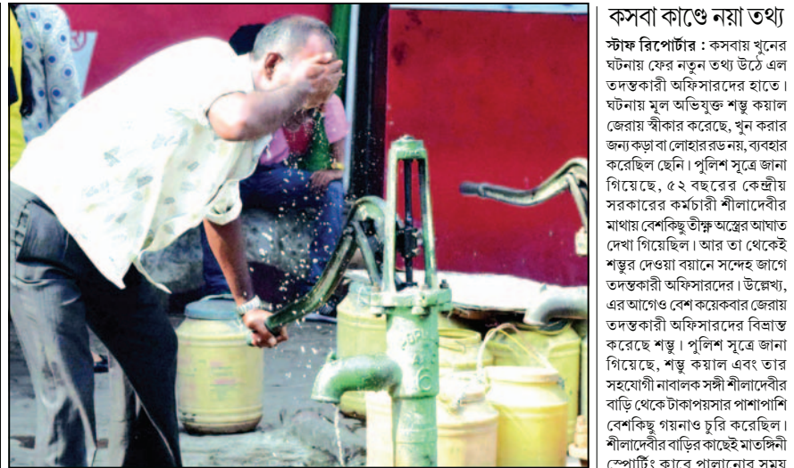
ফণিকের শান্তি...। সোমবার শহরের তাপমাত্রা ছুঁয়েছিল ৪০ ডিগ্রি সেলসিয়াসে। প্রচণ্ড গরম থেকে বাঁচতে ভরসা টিউবওয়েল।

স্টাফ রিপোর্টার: ফের গরমের ছুটি স্কুলগুলিতে। ২০ থেকে ৩০ জুন গরমের ছুটির মেয়ার বাড়িয়ে দেওয়া হল। সোমবার অর্ধাৎ ১৭ জুন খুলেছিল স্কুলগুলি। তবে আরও ১১ দিনের ছুটি ঘোষণা করেছে রাজ্য সরকার। তাপপ্রবাহে জ্বলছে শহরবাসী। নাজেহাল স্কুল পড়ুয়া থেকে শুরু করে প্রত্যেকেই। এই গরমের জন্য স্কুলের গরমের ছুটির মেয়াদ আরও বাড়িয়ে দিল রাজ্য সরকার। আপাতত দাবদায়ে জ্বালা থেকে স্কুলে আসার রেহাই পাচ্ছে স্কুল পড়ুয়া। রবিবার শহরে বিক্ষিপ্ত বৃষ্টির দেখা মিললেও অস্বস্তি বজায় রয়েছে। আবহাওয়া দফতরের দাবি, আরও কয়েকদিন এই আবহাওয়াই বজায় থাকবে। তাই পড়ুয়াদের কথা ভেবে ছুটি বাড়ানোর সিদ্ধান্ত রাজ্যের।