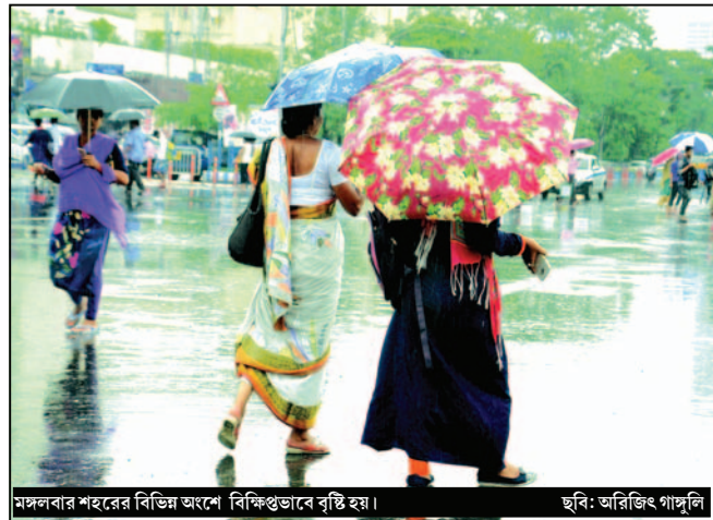
মঙ্গলবার শহরের বিভিন্ন অংশে বিক্ষিপ্তভাবে বৃষ্টি হয়।

স্টাফ রিপোর্টার : বর্ষা এসে গিয়েছে অনেক দিন আগেই। কিন্তু গত কয়েকদিন ধরে বিক্ষিপ্ত বৃষ্টি হলেও ভারী বৃষ্টি দেখা যায়নি। আগামী কয়েকদিনেই ফের কলকাতা সহ দক্ষিণবঙ্গের জেলায় বিভিন্ন জেলায় ভারী বৃষ্টি হতে পারে বলে পূর্বাভাস দিয়েছে