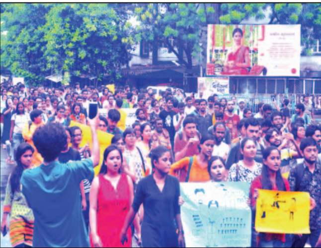
বিশ্ববিদ্যালয়ের মর্যাদা রক্ষার দাবি নিয়ে মিছিলে যাদবপুরের পড়ুয়ারা।

স্টাফরিপোর্টার : অবশেষে যাদবপুর বিশ্ববিদ্যালয়ে ফিরল প্রবেশিকা পরীক্ষা। ২৭ জুনের বিজ্ঞপ্তি বহাল রেখেই মঙ্গলবার কর্মসমিতির বৈঠকে ভর্তি প্রক্রিয়ায় প্রবেশিকা পরীক্ষা ফিরিয়ে আনা হল। প্রবেশিকা পরীক্ষা ও নম্বরের ভিত্তিতে ৫০ : ৫০ ফর্মুলায় নেওয়া হবে ভর্তি। এর আগে এদিন দুপুরে প্রবেশিকা ফিরিয়ে আনার দাবি নিয়ে পথে নামে যাদবপুরের পড়ুয়ারা। যাদবপুর ক্যাম্পাস থেকে মিছিল বের করেন ছাত্রছাত্রীরা। মিছিলটি যায় গোল্ডেন পার্ক পর্যন্ত। সেখান থেকে মিছিল ফেরে ক্যাম্পাসে। প্রবেশিকা পরীক্ষা ফিরিয়ে এনে যাদবপুরের মর্যাদা ও স্বাধিকার রক্ষার দাবিতেই ছাত্রছাত্রীদের এই আন্দোলন। আর সেই দাবিকে সামনে রেখেই গাভি কয়েকদিন ধরে অবস্থানে বসেছেন পড়ুয়ারা। গত শুক্রবার রাত থেকে আবার কয়েকজন অনশনে বসেছেন। এই অনশনের জেরে এখনও পর্যন্ত ৪ জন পড়ুয়া অসুস্থ হয়ে পড়েছেন। তাদের হাসপাতালে ভর্তি করা হয়েছে। কলা বিভাগের বিভিন্ন বিষয়ে স্নাতকোত্তর ভর্তির ক্ষেত্রে যাদবপুরে প্রবেশিকা পরীক্ষা নেওয়ার রেওয়াজ দীর্ঘদিনের। জুলাইয়ের প্রথম সপ্তাহেই সেই পরীক্ষা নেওয়ার কথা ছিল। কিন্তু আইনি