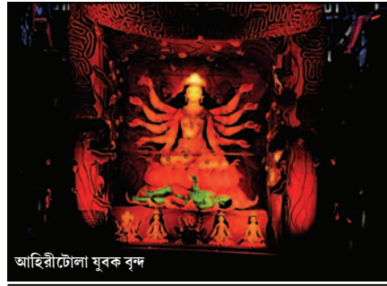
আহিরীটোলা মুরক বৃন্দ