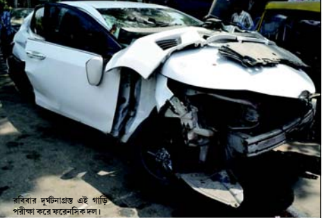
রবিবার দুর্ঘটনাস্থল এই গাড়ি পরীক্ষা করে ফরেনসিক দল।