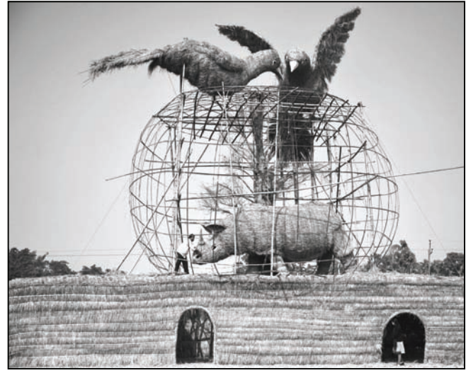
অসমের মরিগাঁওতে মাঘ বিহ উৎসব উপলক্ষে এক কর্মী বাঁশ ও খড় দিয়ে তৈরি করছেন অস্থায়ী কটেজ।