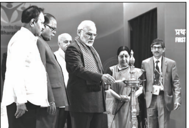
রাজধানী দিল্লিতে মঙ্গলবার প্রধানমন্ত্রী নরেন্দ্র মোদী প্রদীপ জ্বালিয়ে একটি সংসদীয় অন্তর্ভুক্তির উদ্বোধন করছেন।

নয়া দিল্লি, ৯ জানুয়ারি : জেট এয়ারওয়েজের এক এয়ার হোস্টেসকে দিল্লির এক এয়ার হোস্টেসের নির্দেশে জেলে পাঠানো হল। ওই এয়ার হোস্টেসের কাছ থেকে পুলিশ বিপুল পরিমাণ মার্কিন ডলার উদ্ধার করে ভারতীয় ট্যাক্স যার