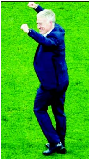
ডিদিয়ার দেশক্যাম্পসেরের সাথে ফ্রান্সের ফুটবলারেরা।

মস্কো, ১১ জুলাই: রাশিয়া বিশ্বকাপে ইউ ফেডারেশন দিল্লির দিনেও এখনও খেতাব জয়ের দিকেই রয়েছে ফ্রান্স। ফ্রান্সের কোচ ডিদিয়ের দেশক্যাম্পসের হেরিয়ারে ফাইনালে খেলার ছাড়াও সফল হওয়ারই লক্ষ্য। এবার লক্ষ্য রাশিয়া বিশ্বকাপে চ্যাম্পিয়ন হওয়া। দেশের অভিনায়ক হিসাবে বিশ্বকাপ জয়ের স্বাদ পেয়েছেন ফ্রান্সের কোচ দিদিয়ার দেশক্যাম্পসের। ১৯৯৮'র বিশ্বকাপে তাঁর অনিন্দিত্যকে ফ্রান্স বিশ্বকাপ জয়ের জয় করেছিল প্রথমবার। এবার কোচ হিসাবে বিশ্বকাপ জয়ের তিনি দেশকে এনে দিতে পারবেন কি না তা অজানা সমস্যা। কিন্তু খেতাব জয়ের দিকে তারা যে ওটি ওটি এগিয়ে চলেছে তা কিন্তু বলা যেতেই পারে। গ্রুপ পর্যায়ে জয়ের পর লক্ষ্য আউট পর্যায়ে জয়ের ধারা বন্ধ রেখে সেমিফাইনালে খেলার খেতাব অর্জন করেছিল ফ্রান্স। ফাইনালে ওগার লুক্‌ভেরি ফ্রান্স টানা দু'বারের মতো ১-০ গোলে জয় পায় একবারে বিশ্বকাপে ডার্বিরই বলে খেলতে নারী ফেডারেশনের বিরুদ্ধে। একবার বিশ্বকাপ দলের সব ফুটবলার নিয়ে এলেও, গ্রুপ পর্যায়ে সেরা হওয়ারই লক্ষ্য। এবারও ফ্রান্সের লক্ষ্যই হল বিশ্বকাপ জয়। ১৯৯৮'র বিশ্বকাপে ডিদিয়ের দেশক্যাম্পসেরের মতো ফ্রান্সের কোচ হিসাবে সফল হওয়াই লক্ষ্য দিদিয়ের দেশক্যাম্পসেরের।