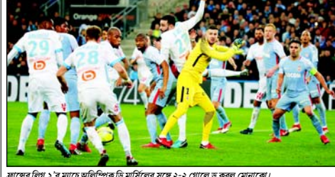
হাজারে লিগ ১'র মাঠে অসিপিপকি মার্সিলের সঙ্গে ২-০ গোলে ড্র করল মোনোরে।