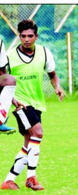
শিবিরের কর্তারা। এরিয়ান ম্যাচ হারলেও ফুটবলারদের দোষারোপ করতে রাজি নন রঘু। ম্যারামান নিতে রাজি নন সাদা-কালো

স্টাফ রিপোর্টার : কলকাতা লিগ খেতাব মহম্মেডান শেখবর জয় করেছিল ১৯৮১-৮২ মরশুমে। এরপর গল্প থেকে বহু জল গড়ালেও লিগ খেতাব অথবা অর্ধশতাব্দীর পরে মহম্মেডানের হাতে রেনবো এফসি ম্যাচের স্মরণে ম্যাচের স্মরণে ম্যাচের স্মরণে