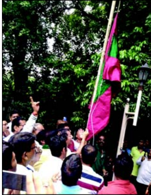
স্টাফ রিপোর্টার: আট বছর পর কলকাতা লিগ খেতাব হাফহাড়া হয়েছিল সবুজ-কমলা লিগের। তুঙ্গবনে মোহনবাগানে। গতবার পোলের গড়ে পিছিয়ে থেকে