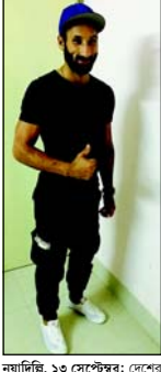
নারায়ণি, ১৩ সেপ্টেম্বর: সেরের জারি গিয়ে ৩৫০টা ম্যাচ খেলার পর অবসরে হকি থেকে অবসর নেয়ার সিদ্ধান্ত ঘোষণা করেন সর্দার সিং। ১১ বছর ভারতের জারি গিয়ে দক্ষতার সঙ্গে খেলেছেন সর্দার সিং। জর্ডানী এশিয়ান গেমসের আগেও ৩২ বর্ষীয় সর্দার সিং ইয়ে টেনে টেনে সর্দার থেকে এগিয়ে ছিলেন। ২০০৬ সালে জুনিয়র দলে পোলাভের বিরুদ্ধে অভিভূত হয়েছিল তাঁর এবং ২০০৬ সালে সিনিয়র দলে চিত্রপ্রতীক পাকিস্তানের বিরুদ্ধে দেশের জারি গিয়ে ২০০৬ সালে থেকে ভারতীয় হকি দলের অধিনায়ক ছিলেন তিনি। ২০১৪ সালে এশিয়ান গেমসে গিয়ে ২০১৪ সালে ২০১৪ সালে কমনওয়েলথ গেমসে রুগো জেটেন এবং সদ সদ সমা জর্ডানী এশিয়ান গেমসে ম্যাগ জেতার পরই অবসরের কথা মাথায় এগিয়ে আসে। হকি বিশ্বকাপে আসে নেওয়ার আগেই অবসর ঘোষণা করেন তিনি।