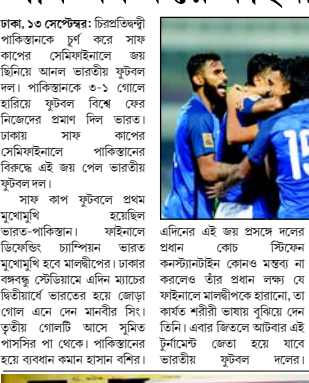
ঢাকা, ১৩ সেপ্টেম্বর: চিত্রপ্রতীক পাকিস্তানকে চূর্ণ করে সাফ কাপের সেমিফাইনালে জয় ডিনিয়ে পালন ভারতীয় ফুটবল দল। পাকিস্তানকে ০-১ গোলে হারিয়ে ফুটবল বিশ্বে ফের নিজেদের প্রমাণ দিল ভারত। ঢাকায় সাফ কাপের সেমিফাইনালে পাকিস্তানের বিরুদ্ধে এই জয় পেল ভারতীয় ফুটবল দল।