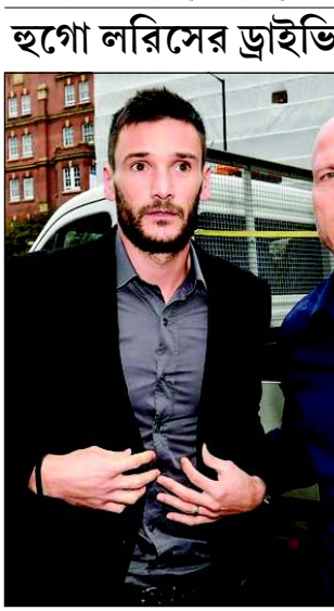
লন্ডন, ১৩ সেপ্টেম্বর: মদ্যপ অবস্থায় গাড়ি চালানোর অভিযোগে ছগো লরিসের ড্রাইভিংয়ে নিষেধাজ্ঞা জারি করল লন্ডনের গ্রেফটিনকারি ম্যাজিস্ট্রেট আদালত। আদালতের নির্দেশনামুতায় আগামী ২০ মাস ড্রাইভিংয়ে নিষেধাজ্ঞা জারি হলেও হাজতবন্দ্য করতে হবে ছগো লরিসের বিধকপত্রী অধিনায়কত্বে।

যখনও ওরফে বিচার করে প্রথমে লরিসের প্রায় ৬ মাস পর্যন্ত হাজতবন্দ্য হতে পারে বলে আশংকা করা হয়। তবে এক্ষেত্রে ড্রাইভিং বন্ধ করে পাশাপাশি রিসিসে ৫০ হাজার পাউন্ড জরিমানা করতেই তাঁকে ছাড় দিয়েছে আদালত। দীর্ঘ কুড়ি বছর বয়স গুট ১৫ ভুলই লরিসের নেতৃত্বেই দ্বিতীয়বারের জন্য বিধকপত্র হেভে ফ্রাঞ্চ। তবে কাটিয়েই বিবেক জড়িয়ে পড়েন ইলিশ ব্রান্ড প্রিমিয়ার লিগ টুর্নামেন্ট হুইপারের এই পোলকারি। গত ২৪ আগস্ট স্টেটুল লরিসের রাষ্ট্রায় লরিসের গাড়িটি রুটিন চেকের জন্য আটকায় পুলিশ। সেময়ম মদ্যপ অবস্থায় গাড়ি চালানিয়ে লরিস। এই ঘটনায় লরিসকে সতর্ক করা হয়।