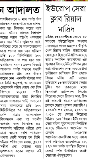
মাদ্রিদ, ১৩ সেপ্টেম্বর: ২০১৭-১৮ মসুমের ইউরোপিয়ান অঞ্চলে নজরকড়া পারফরম্যান্সের স্বীকৃতি পেল রিয়াল মাদ্রিদ। ইউরোপের সেরা ক্লাব হিসাবে নির্বাচিত হয়েছে তারা।