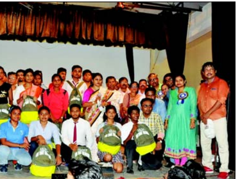
আড়িয়াহে স্বাভাচার উচ্চ বিদ্যালয়ে অনুষ্ঠিত হল 'কলকাতা আমি তোমায় ভালবাসি' সংস্করণ পঞ্চম বার্ষিকী অনুষ্ঠান। এই সংস্থা বিভিন্ন জায়গা থেকে ৩৫ জন খেলোয়াড়কে (খোশো, কুবাতি, যোগা) খেলার প্রয়োজন মতো সামগ্রী প্রদান করলেন। এটি একটি সমাজ সেবামূলক প্রতিষ্ঠান।