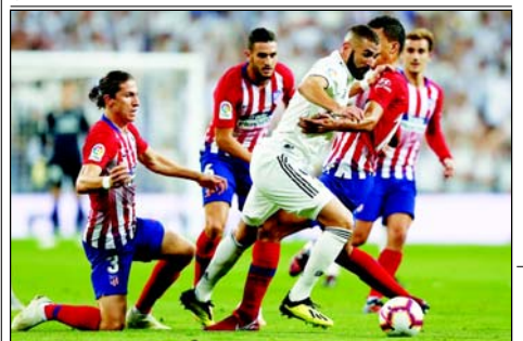
স্প্যানিশ লা লিগার পেলনুয়া ড্র করে রিয়ান মাদ্রিদ ও আটলেনিগো মাদ্রিদ।