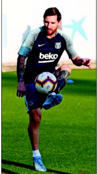
বার্সেলোনার প্রাকটিনস লিওনেলে মেসি