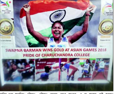
SWAPNA BARMAN WINS GOLD AT ASIAN GAMES 2018 PRIDE OF CHARUCHANDRA COLLEGE