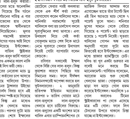
ইস্টবেঙ্গল বিমান কনকরা অফিসের দায়-দায় ফুটবলাররা।