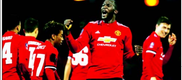
এফএ কাপে ইংল্যান্ডের ৪-০ গোলের ব্যবধানে হারান ম্যান্চেস্টার ইউনাইটেড।