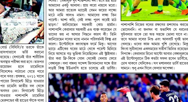
ন্যাটালি, ৪ নভেম্বর: ইলিট মিলেছিল আগেই। তবু না অ্যাগনে বিশ্বাস নেই গোছের সামান্য সংখ্য থেকেই গিয়েছিল।

প্রকাশক: পার্থ কুণ্ড, কর্তৃক ও, বীরেন্দ্রকুমার তরঙ্গ সর্দার, শিলিগুড়ি-৭৪৪০০১ থেকে প্রকাশিত এবং ইংকো প্রিন্টিং প্রেস, যারুভিতা, মিলন মোড়, শিলিগুড়ি-৭৪৪০০৩ থেকে মুদ্রিত। ● স্বাধীনবাহিনী: আশিস নাহা ● মুখ্য সম্পাদক: কমল ভট্টাচার্য সম্পাদক: আশিস নাহা