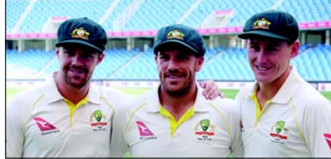
দুজন। জিন্দাবাদের চামু চিনাবাকে ১২৬টি আন্তর্জাতিক ম্যাচ এবং ভারতের সুশ্রে রানাককে টেস্ট অভিষেকের আগে ১১৬টি আন্তর্জাতিক ম্যাচ খেলতে হয়েছিল। এদিন আর অস্ট্রেলিয়ান ক্রিকেটারের টেস্ট অভিষেক হল। এরা হলেন ট্রেভিস হেড ও মার্নি লাকুসে। ৫৫টি আন্তর্জাতিক ম্যাচ খেলার পর হেডের টেস্ট অভিষেক হল। আর ট্রেভিসের মাধ্যমেই আন্তর্জাতিক ক্রিকেটে পা রাখছেন লাকুসে।

দুইই, ৭ অক্টোবর : পাকিস্তানের বিপক্ষে আজ অস্ট্রেলিয়ার টেস্টে প্রথমবারের মতো মার্চে নামলেন আরন ফিঙ্ক। আন্তর্জাতিক ক্রিকেটে প্রায় সাত বছর কাটলে টেস্ট অভিষেক হল ফিঙ্কের। এতদিন অপেক্ষা করার পর টেস্ট অভিষেক এনে দেবে গড়লেন এই মার্চুটে ব্যাটসম্যান। ২০১১ সালে আন্তর্জাতিক ক্রিকেটে অভিষেকের পর থেকে টেস্ট অভিষেকের আগে পর্যন্ত ৯৩টি একদিনের ম্যাচ ও ৪২টি টি-২০ ম্যাচ খেলেছেন তিনি। দুই ফরম্যাটে মিলিয়ে ১৩৫টি আন্তর্জাতিক ম্যাচ খেলার পর তাকে অভিষেক দায়িত্ব দিল টেস্ট কাপ হিসেবেই তাঁর। আর কেনও অস্ট্রেলিয়ান ক্রিকেটারকে টেস্ট