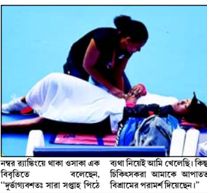
নম্বর ব্যাকিয়ে থাকা ওসাকা এক ব্যথা নিয়েই আমি খেলোছি। কিন্তু বিবৃতিতে বলেছেন, চিকিৎসকরা আমাকে আপাতত "দূর্বল" বলায় সন্তোষিত। বিশ্বের ৬

বেঞ্জি, ৭ অক্টোবর : পিঠের চোটের কারণে আজ থেকে শুরু হতে যাওয়া হংকং ওপেন থেকে নাম প্রত্যাহার করে নিলেন ইউএস ওপেন বিজয়ী নাওমি ওসাকা। শনিবার বেইজিংয়ে চায়না ওপেনের সেমিফাইনালে অনাসতাসিতা সোভাসতোভার বিপক্ষে হেরে যাওয়া ম্যাচটিতে চোট পেড়েন এই জাপানি সুপারস্টার। ওই সময় কোর্টেই তাঁর চিকিৎসা হয়। চোটের মাত্রা যাত ওরুতর না হয় সেই কারণেই ডব্লিউটিএ হংকং ওপেন থেকে নাম প্রত্যাহার করার সিদ্ধান্ত নিয়েছেন ওসাকা। বিশ্বের ৬