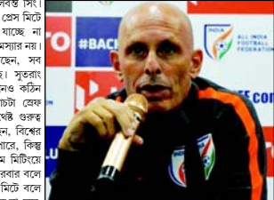
ফুটবলাররা নিজেদের সেরাটা উজাত করে দেন। এআইএফএফ কর্তার চেষ্টা করলে, এশিয়ান গেমের আগে ভারতীয় দলকে শক্তিশালী প্রতিদ্বন্দ্বের বিরুদ্ধে ম্যাচ খেলানো হবে। স্টিফেনের কথায়, হেলেনের প্রথম কাছে হবে। এশিয়ান গেমের মূল পর্বে এদের মধ্যে জেতার লক্ষ্য নিয়েই নামবে। যদি আমরা জিততে না পারি, মাচাটা খেলে অভিজাত সম্ভাব্য হবে। নিচেবলে আরও একটি ফ্রেন্সি ম্যাচ খেলার কথা ভারতের। চিনের মাচাটা ভারতীয় ফুটবলারদের কাছে যথেষ্ট চ্যালেঞ্জিং। কারণ এই ম্যাচ দেখেই নিশ্চয়ই জানুয়ারির এএফসি এশিয়ান কাপের দল নির্বাচনের পরিকল্পনা করবেন স্টিফেন। দিল্লিতে কাপের ৯৯ বিরুদ্ধেই দেখতে হবে আমাদের।

স্টাফ রিপোর্টার: বলন্ত নিরুচ্ছ্রি ফ্রেন্সি ম্যাচ খেলতে চিনে উড়ে গেল ভারতীয় দল। ১০ তারিখ চিনের বিরুদ্ধে এই প্রথম আন্তর্জাতিক ম্যাচ খেলবেন সুদীপ ছেত্রী। এই ম্যাচে খেলতে পারবেন না এটিকে স্টুইভেন। পাদপার্ট সমস্যার জন্য দলের সঙ্গে যেতে পারলেন না বলন্ত সিং চিনে রওনা দেওয়ার আগে পরিচয়ে প্রেস মিটে ভারতের কোচ জানান, বলন্তকে ম্যাচ না আনবেন বলে। তবে এটা কোনও সমস্যার নয়, স্টিফেন যেভাবে দলটাকে গাভ্রেনে, সব পরিশ্রমেই যথেষ্ট অপনয় রয়েছে। সুজাত, বলবন্তের বলি খুঁজে নেওয়া কোনও কঠিন কাজ নয়। হাতে পরে চিনের মাচাটা ফেই ফ্রেন্সি ম্যাচ। কিন্তু মাচাটাকে ফেই ওফুর্দ দিচ্ছেন স্টিফেন। সাফ বলে দিচ্ছেন, বিশেষ কাছে এটা ফ্রেন্সি মেমস হতে পারে, কিন্তু আমাদের কাছে নয়। প্রাকটিকসে টিম মিটিংয়ে স্টিফেন ফুটবলারদের যে কথাটা বারবার বলে থাকেন, সেই কথাটাই এদিন প্রেস মিটে বলে গেল। ফ্রেন্সি, মো ফ্রেন্সিই যাই হোক না কেন, এটা মাথায় রাখতে হবে জাতীয় দল থেকে। বিগের কাছে ফ্রেন্সি ম্যাচ হলেও আমাদের কাছে নয়।