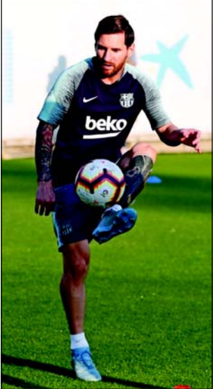
বার্সেলোনার প্রাকটিকসে লিওনেলে মেসি।

এমন বলের ফলে। রোহিত শর্মা এবং শিবর গাওয়ারি বনে রেল কিল্ল হঠাৎ করে মহেশ সিং খোনিকে জোর করে অধিনায়কের দায়িত্বে পাঠানো হয়। ৬৯৬ দিন আগে নিজেই অধিনায়কের দায়িত্ব হাতে নিয়েছিল। তাকে হঠাৎ করেই বের করে দেওয়াটা মোটেই পছন্দ করেনি নির্বাচকরা। এ নিয়ন্ত্রণ তারা টিম ম্যানেজমেন্টের সঙ্গে কথা বলবেন বলেও জানা গেছে।