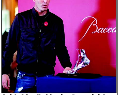
জিডান ক্রিস্টাল ফুট'র উদ্বোধনে ইউরোপীয় লিগেডেব্রিটি আয়োজকসেশনের সময় জিডানি জিডান।