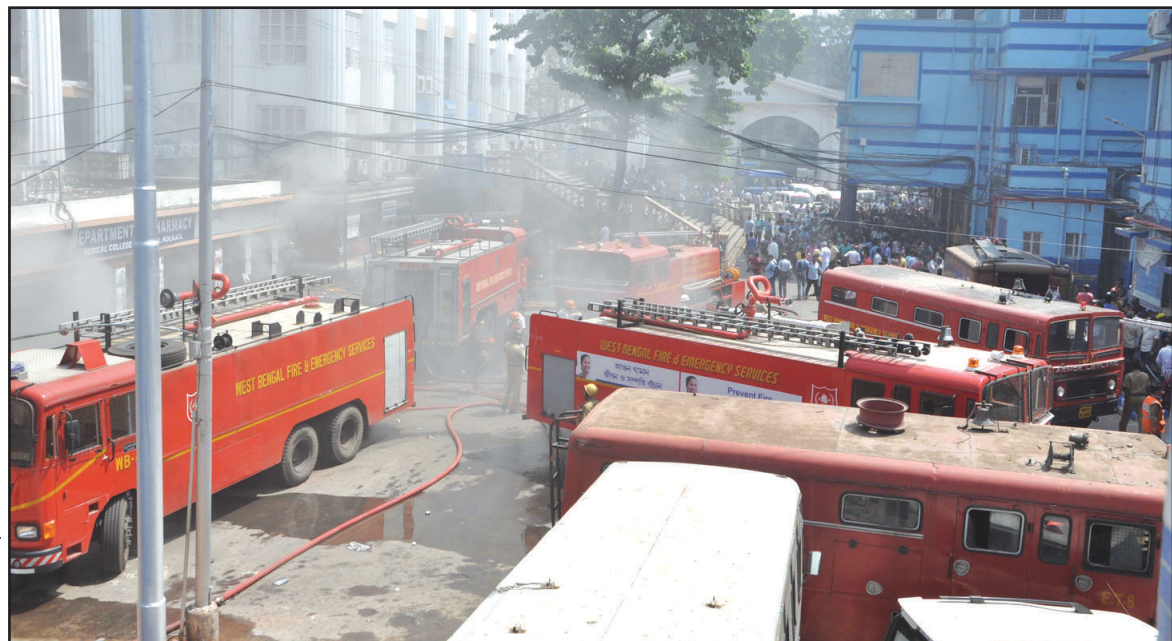
কলকাতা মেডিক্যাল কলেজে অগ্নিকাণ্ডের পর আগুন নেভাতে তৎপর দমকল কর্মীরা।

স্টাফ রিপোর্টার: শহরে একের পর এক অগ্নিকাণ্ডে ছড়িয়ে পড়েছে ব্যাপক আতঙ্ক। বৃহবার কলকাতা মেডিক্যাল কলেজের অগ্নিকাণ্ডে ভস্মীভূত হল এমসিএচ বিল্ডিংয়ের ওয়ুধের ভান্ডার। দমকলের ১০টি ইঞ্জিন ঘটনাস্থলে আসে। কোনও রুঁকি না নিয়েই দ্রুত রোগীদের অন্যত্র সরানো হয়। সকালে আগুন লাগার পর ওয়ুধের কাউন্টার সংলগ্ন ওয়ার্ডগুলিতে দ্রুত ২৫০ জন রোগীকে নামিয়ে আনা হয়। ধোঁয়ায় অন্ধকার হয়ে আসে গোটা এলাকা। দমকল কর্মীদের চেষ্টায় ওয়ুধ কাউন্টারের পাশে থাকা অগ্নিজেন শিলিঙের গুদামে আগুন ছড়িয়ে পড়তে পারেনি। কি কারণে ওয়ুধের গুদামে আগুন লাগল তা খতিয়ে দেখাচ্ছে দমকল কর্মীরা। এদিক আতঙ্ক ছড়িয়ে পড়েছে রোগী ও তাদের আত্মীয়