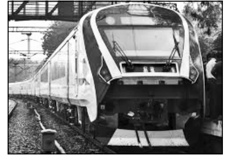
মোট ১৬টি কামরার ১১২টি আসন রয়েছে। এখন সবক'টি 'চেয়ার কার'। পরবর্তীকালে কেসব কিছু কামরা স্লিপার ক্লাসে রূপান্তরিত করা হবে। জানা যাচ্ছে রাজধানী এক্সপ্রেসের পরিবর্তে এমনই 'ইন্টারসিটি ইলেক্ট্রিক মাল্টিপল ইউনিট' ট্রেন আনা হবে। ২০২০ সালের মধ্যে নিয়ে আসা হবে ট্রেনটি।