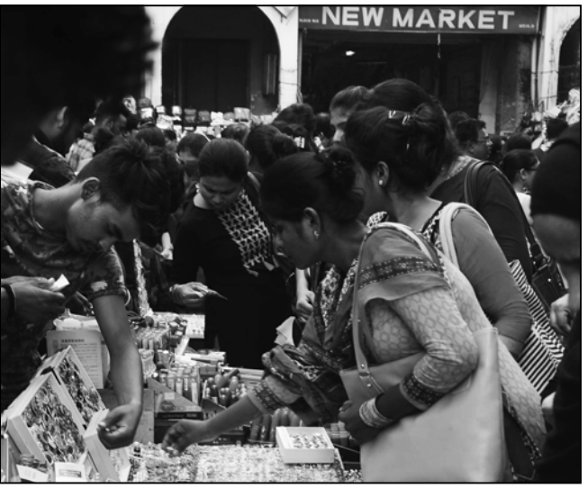
হাতে আর মাত্র কটা দিন। নিউ মার্কেটে প্রসাধনী সামগ্রী কিনতে ব্যস্ত তরুণীরা।