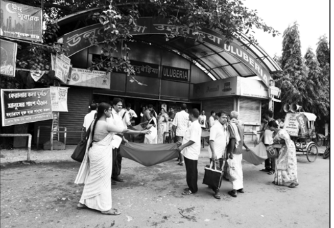
কেরালার বন্যা দগ্ধ মানুষের পাশে দাঁড়ানোর জন্য এসইউসির তরফে ত্রাণ সংগ্রহ করা হচ্ছে উল্বেড়িয়ায়।

ফিরে আসা হিন্দুরা এই জন্যই এখানে থাকতে এসেছিলেন। নাগরিকত্ব আইন সংশোধনী বিল নিয়ে প্রতিক্রিয়া দিতে গিয়ে মন্তব্য করেন রূপা। হিন্দুদের শরণার্থী ও মুসলিমদের অনুপ্রবেশকারী মনে করেন কিনা প্রশ্নের জবাবে তাঁর প্রতিক্রিয়া, শুধু হিন্দুরা কেন বৌদ্ধ ও জৈনরা শরণার্থী। রাজ্যসভার সাংসদ আরও বলেন, এ দেশে জন্মানো বক্তাদের এনআরসি নিয়ে ভয় পাওয়ার কোনও প্রয়োজন নেই। সম্প্রতি বিজেপি-র জাতীয় সহসভাপতি ওম মাধুরও এনআরসি ও নাগরিকত্ব আইন প্রসঙ্গে মন্তব্য করে বিতর্ক সৃষ্টি করেছিলেন। তিনি বলেছিলেন, দেশ কোনও ধর্মশালা নয়। এবং ২০১৯ লোকসভার পর গোটা দেশেই বাংলাদেশি অনুপ্রবেশকারী চিহ্নিত করতে এনআরসি চালু করা হবে। প্রসঙ্গত অসমে নাগরিকপঞ্জির খসড়া প্রকাশ করে এমনিই বিতর্ক সৃষ্টি করেছে কেন্দ্রীয় সরকার। এরমধ্যেই ২০১৯ লোকসভার আগে শীতকালীন অধিবেশনে নাগরিকত্ব আইন সংশোধনী বিল আনা হতে পারে বলেও জল্পনা রয়েছে।