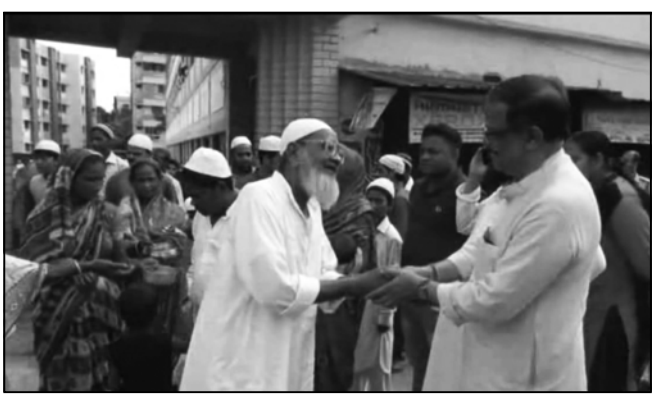
বৃহস্পতিবার সকালে দেবদেবী নন্দীমালায় হাওড়ার মুসলিম ধর্মাবলম্বী মানুষরা সকালে দিয়ে চলে কুশল করেন। এদিন আসানসোল ঈদগাহে পৌছে কুশল বিনিময় করতে দেখা যায় রাজ্যের স্ত্রী মনোরম ঘটকে। সকালে স্নান শেষে কচিকাঁচা থেকে প্রবীণ সকলেই পৌছায় ঈদগাহে। সেখানে চলে নমাজ পাঠ। নমাজ শেষে আলিঙ্গনের মধ্য দিয়ে চলে কুশল বিনিময়।