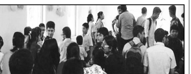
ওয়েবসাইটেও দেওয়া আছে সিবিএসসির অনুমোদনের কথা। সিবিএসসি বোর্ডের পরীক্ষার জন্য মঙ্গলবার বোধিবন কলেজিয়েট স্কুলে রেজিস্ট্রেশন করাতে আসে ছাত্র-ছাত্রীরা। অভিযোগ, তাদের রেজিস্ট্রেশন না করিয়ে পরে খবর দেওয়া হবে বলে জানায় স্কুল কর্তৃপক্ষ। আর তাতেই সন্দেহ বাড়ি। খবর পেয়ে স্কুলে আসেন অভিভাবকরাও। অভিযোগ, অষ্টম শ্রেণি পর্যন্ত অনুমোদন থাকলেও, একাদশ ও দ্বাদশ শ্রেণির ছাত্র-ছাত্রীদেরও ভর্তি নেওয়া হয় ওই বেসরকারি স্কুলটিতে। অন্য স্কুল থেকে দেওয়ানো হয় নবম, দশম, একাদশ ও দ্বাদশ শ্রেণির পরীক্ষা। এতদিন আসানসোলে গিয়ে