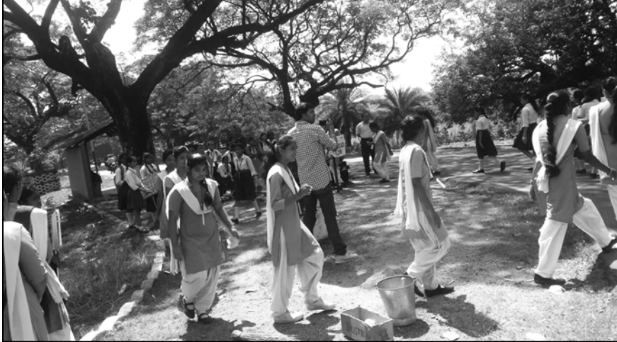
চিত্তরঞ্জন লোকোমোটিভ ওয়ার্কসের উদ্যোগে আয়োজিত হল বৃহত্তা হি সেবা পক্ষ। এই উপলক্ষে ডিভি গার্লস স্কুলের ছাত্রীরা একটি সচেতনতামূলক অনুষ্ঠান করে।

লখনউ, ২ অক্টোবর: সপ্তম বেতন কমিশন অনুযায়ী বেতন বৃদ্ধি নিয়ে ক্রমশ অপেক্ষা বাড়ছে সরকারি কর্মীদের। শুধু তাই নয়, ন্যূনতম বেতন বৃদ্ধি নিয়েও অপেক্ষা বাড়ছে। যদিও মনে করা হচ্ছে আগামী বছর লোকসভা নির্বাচন। তার আগে এই বিষয়ে বড় সিদ্ধান্ত নিতে চলেছে মৌদী সরকার।