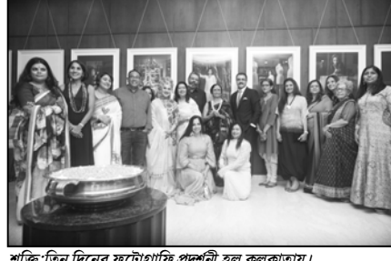
শক্তি:তিন দিনের ফটোগ্রাফি প্রদর্শনী হল কলকাতায়।