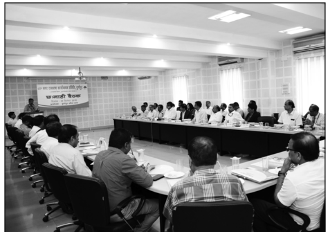
ডিএসপিআই উদ্যোগে মানব সংশোধন বিকাশ কেন্দ্রে সম্মেলনের বৈঠক অনুষ্ঠিত হল শনিবার।

ট্রাইব্যুনালগুলির দক্ষতা বাড়ানোর ওপর জোর দেন। ঋণ পুনরুদ্ধার ব্যবস্থার মাধ্যমে অনাদায়ী ঋণ আদায়ের প্রক্রিয়াকে আরও জোরদার করা দরকার বলে তিনি অভিমত ব্যক্ত করেন।