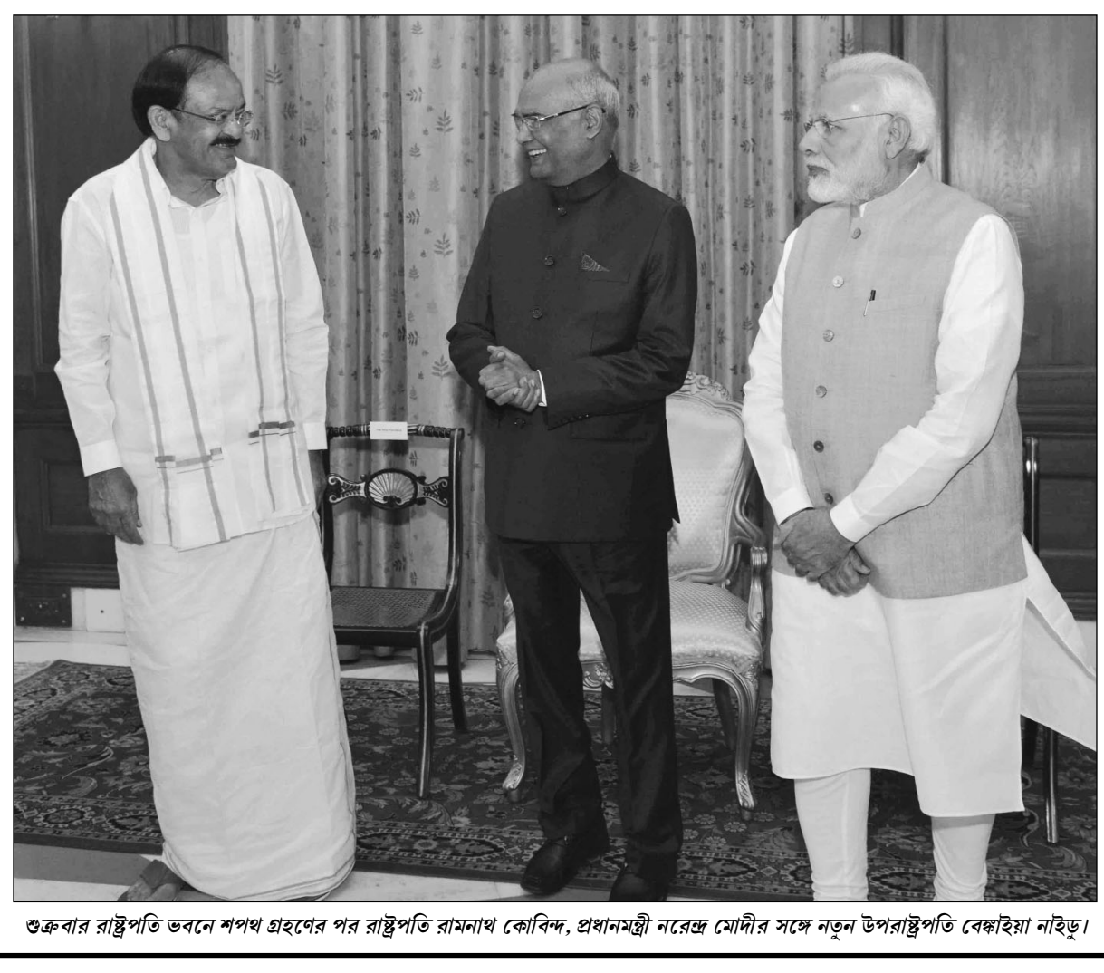
শুক্রবার রাষ্ট্রপতি ভবনে শপথ গ্রহণের পর রাষ্ট্রপতি রামনাথ কোবিন্দ, প্রধানমন্ত্রী নরেন্দ্র মোদীর সঙ্গে নতুন উপরাষ্ট্রপতি বেঙ্কাইয়া নাইডু।