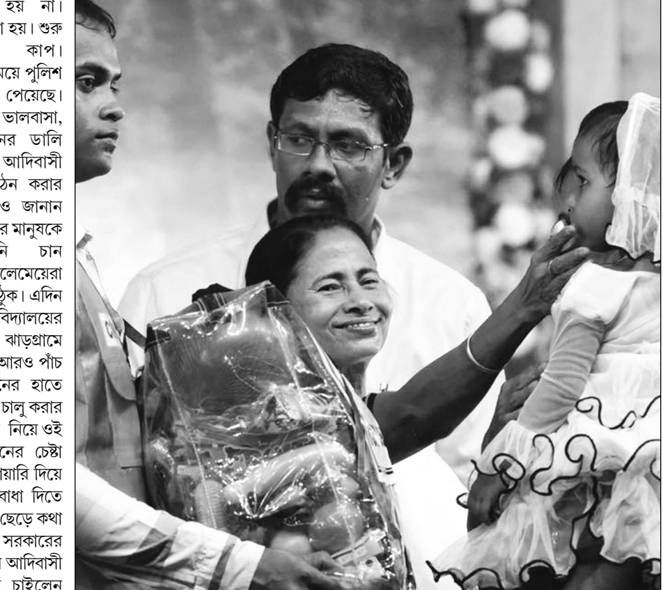
ঝাড়গ্রামে এক অনুষ্ঠানে একটি শিশুকে আদর করছেন মুখ্যমন্ত্রী মমতা বন্দ্যোপাধ্যায়।

সামনেই পঞ্চায়েত ভোট। তাই সেকথা মাথায় রেখে জঙ্গলমহলের আদিবাসী মানুষের কাছে তিনি সার্বিকভাবে তাঁর সরকারের সাফল্য তুলে ধরেন এদিন। মনে করিয়ে দিলেন এক সময় এই ঝাড়গ্রাম, বেলপাহাড়ি, বিনপূর আসতে ভয় পেত সাধারণ মানুষ। কাউকে প্রশাসন যাওয়ার অনুমতি দিত না। মাওবাদীদের হাতে খুন-জখম ছিল নিত্যনৈমিত্তিক বিষয়। এখন পরিস্থিতির পরিবর্তন হয়েছে। বহু সাধারণ মানুষ ও পর্যটক এখানে নির্ভয়ে আসেন। জঙ্গলমহলের ছেলেমেয়েরা আতঙ্ক কাটিয়ে স্কুল-কলেজে যায়। এখন মাওবাদীদের হাতে কাউকে মরতে হয় না। জঙ্গলমহলে এখন খেলাধুলা হয়। শুরু হয়েছে জঙ্গলমহলে কাপ। জঙ্গলমহলের প্রচুর ছেলেমেয়ে পুলিশ ও অন্যান্য দফতরে কাজ পেয়েছে। আদিবাসীদের প্রতি তাঁর ভালবাসা, তাঁদের জন্য ও উন্নয়নের ডালি সাজাচ্ছেন তিনি। তাই আদিবাসী অধ্যুষিত পৃথক জেলা গঠন করার সিদ্ধান্ত নেন তিনি বলেও জানান মুখ্যমন্ত্রী। তিনি জঙ্গলমহলের মানুষকে ভালবাসেন। তাই তিনি চান জঙ্গলমহলের আদিবাসী ছেলেমেয়েরা উচ্চশিক্ষায় শিক্ষিত হয়ে উঠুক। এদিন তিনি ঝাড়গ্রামে একটি বিশ্ববিদ্যালয়ের প্রতিশ্রুতি দেন। পাশাপাশি ঝাড়গ্রামে একলব্য ময়দানের জমি ও আরও পাঁচ বিঘা জমি রামকৃষ্ণ মিশনের হাতে তুলে দেন উন্নয়নের স্কুল চালু করার জন্য। কিছুদিন আগে এটি নিয়ে ওই এলাকায় বিরোধী আন্দোলনের চেষ্টি করা হয়। তাই মুখ্যমন্ত্রী ঈশ্বরিয়া দিয়ে বলেন, ভাল কাজে কেউ বাধা দিতে গেলে সরকার ও প্রশাসন ছেড়ে কথা বলবে না। সব মিলিয়ে তাঁর সরকারের কর্মকাণ্ড তুলে ধরার মাধ্যমে আদিবাসী মানুষের মন জয় করতে চাইলেন মুখ্যমন্ত্রী মমতা বন্দ্যোপাধ্যায়।