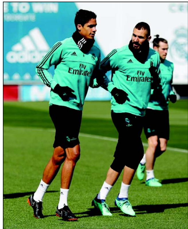
স্প্যানিশ লা লিগায় মালাগা ম্যাচের আগে রিয়াল মাদ্রিদ ফুটবলারদের অনুশীলন।